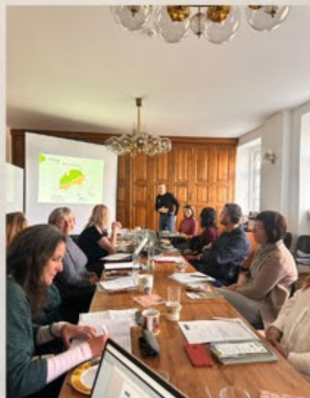
Foto: jednání Hospodářské komise Euroregionu Krušnohoří (Boží Dar)

Dne 8. listopadu se na Božím Daru uskutečnilo jednání Hospodářské komise Euroregionu Krušnohoří, již jsme členem. Společně s dalšími členy z české i saské strany jsme diskutovali možnosti projektových žádostí ve Fondu malých i velkých projektů, seznámili se podrobně s činnostmi sousední DA Krušnohoří a inspirovali se v možnostech vzájemné spolupráce na podpoře rozvoje turismu v regionu. V současné době zpracováváme žádost na konferenci Stop & Stay, kterou budeme v roce 2025 realizovat s německými partnery společně v Klášterci nad Ohří.