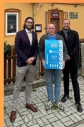
Foto: předání nabíjecího sloupku v Libořicích (vlevo), předání wallboxu v Libědicích (vpravo)

První vyrobené prvky doprovodné infrastruktury začínáme postupně realizovat a předávat zapojeným obcím. Předán byl nabíjecí wallbox na elektrokola v Libědicích, nabíjecí stojan pro elektrokola v Libořicích a postupně začneme realizovat i prvky dřevěné. Vyrobené jsou již altány s posezením i dřevěné infotabule. Proběhla také kontrola, oprava a údržba Bikeboxu v kadaňských Rooseveltových sadech.