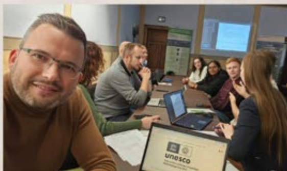
Foto: Jednání pracovní skupiny UNESCO

Pokračuje pravidelné setkávání členů pracovní skupiny pro UNESCO, kulturu a cestovní ruch v Žatci. Při posledním setkání byla projednávána spolupráce se zahraničními studenty, webová prezentace nebo společné marketingové aktivity.