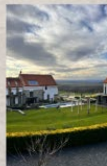
Foto: Podpis smlouvy o vstupu do DF DADP (Libořice), resort Oblík

Naši partnerskou základnu rozšířili tento rok další členové, kteří vstoupili do Destinačního fondu DADP. Jedná se o obce Březno u Chomutova, Libědice u Kadaně, Libořice u Žatce, pivovar Zichovec, obec Lenešice u Loun a resort Oblík. Vzájemné spolupráce si velmi vážíme a děkujeme za podporu.